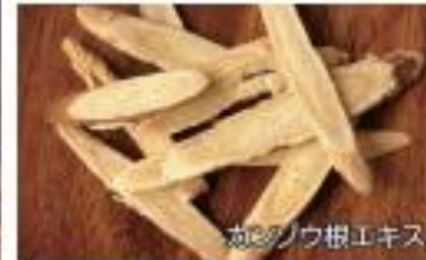
カシノウキエキス