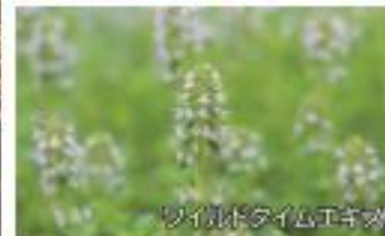
ワイルドタイムエキス