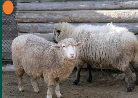
羊毛抽出のケラチン (AEDSケラチン)