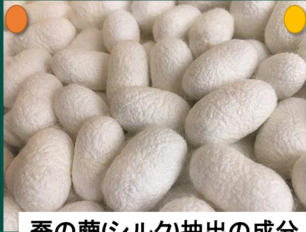
蚕の繭(シルク)抽出の成分