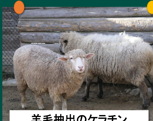
羊毛抽出のケラチン ( \alpha や \gamma 型のケラチン)