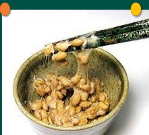
納豆のねばねば成分である ポリグルタミン酸