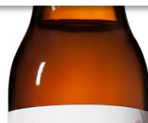
動物の皮抽出のコラーゲン