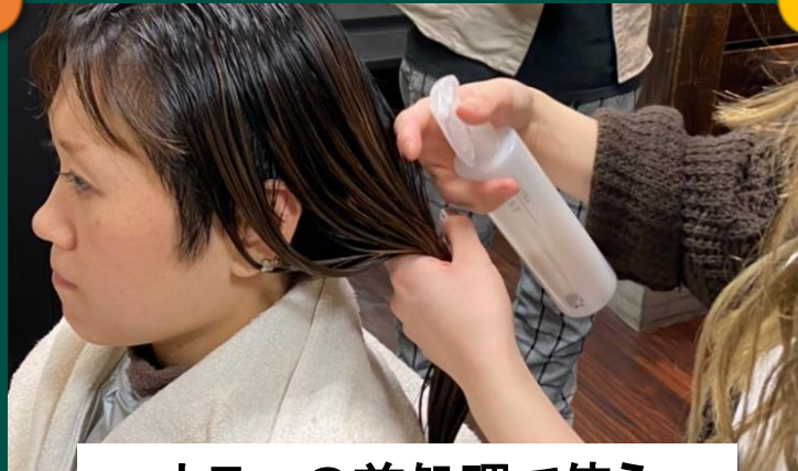
カラーの前処理で使う